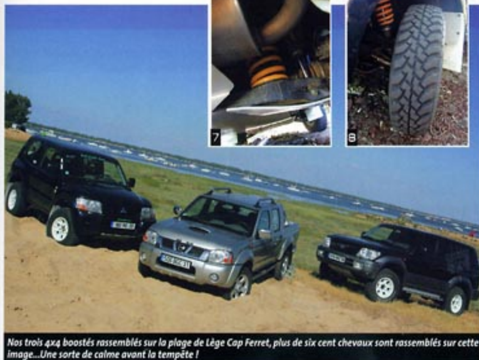
Nos trois 4x4 boostés rassemblés sur la plage de Lège Cap Ferret, plus de six cent chevaux sont rassemblés sur cette image... Une sorte de calme avant la tempête !